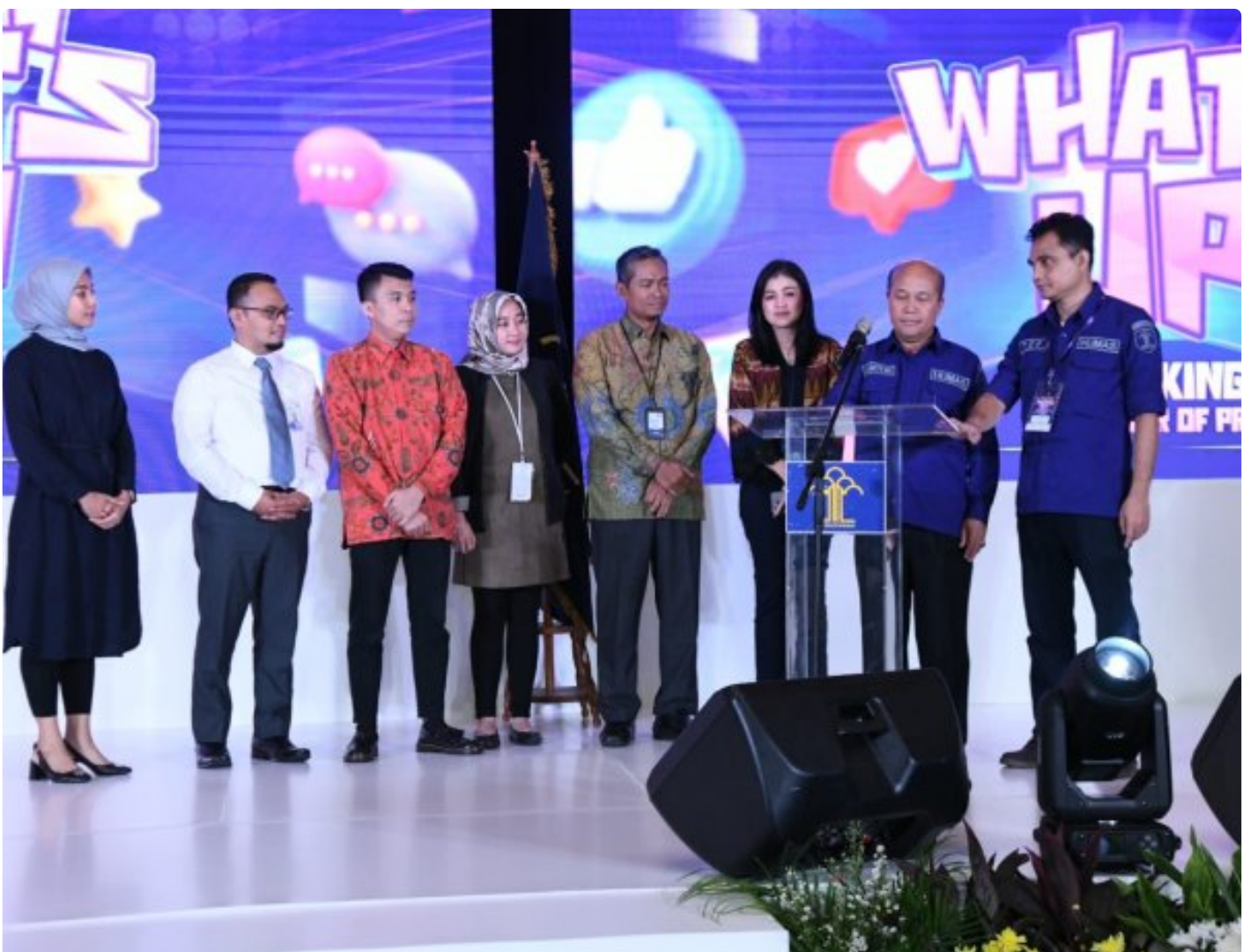
Humas Kemenkumham RI adakan Acara Bertajuk What's Up

JAKARTA - Kementerian Hukum dan Hak Asasi Manusia (Kemenkumham) menyelenggarakan kegiatan bertajuk "What's Up". Acara ini digelar sebagai upaya peningkatan kapasitas dan kompetensi insan humasnya.